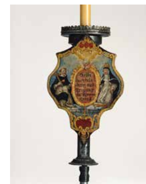
Einige der Bruderschaftsschilde mit den Kerzenhaltern, von denen es ebenfalls 15 Stück gibt.