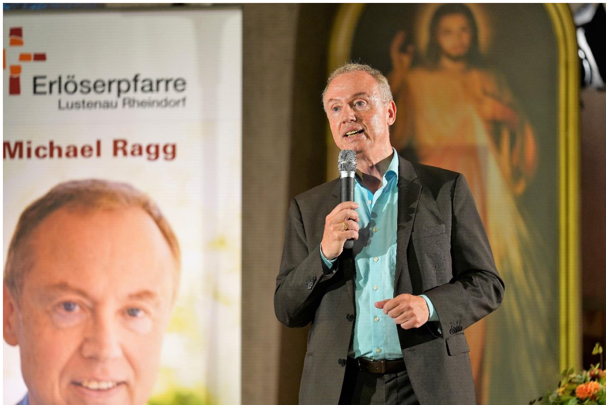
Vortrag bei der 'Missionarischen Woche' der Erlöserpfarre Lustenau/Österreich, September 2021

Zum Valentinstag 2022 sendete das katholische Radio Horeb sein Interview des Tages mit Michael Ragg zum Konzept der 'Herztöne' und den Erfahrungen mit diesem beliebten Angebot .