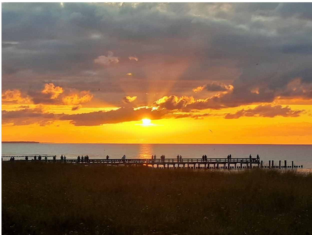
Sonnenaufgang am Strand von Zingst an der Ostsee - Mit guten Gedanken aus der 'Seelischen Hausapotheke' dringt das Licht des Geistes durch Nebel und Gewölk unseres Alltags