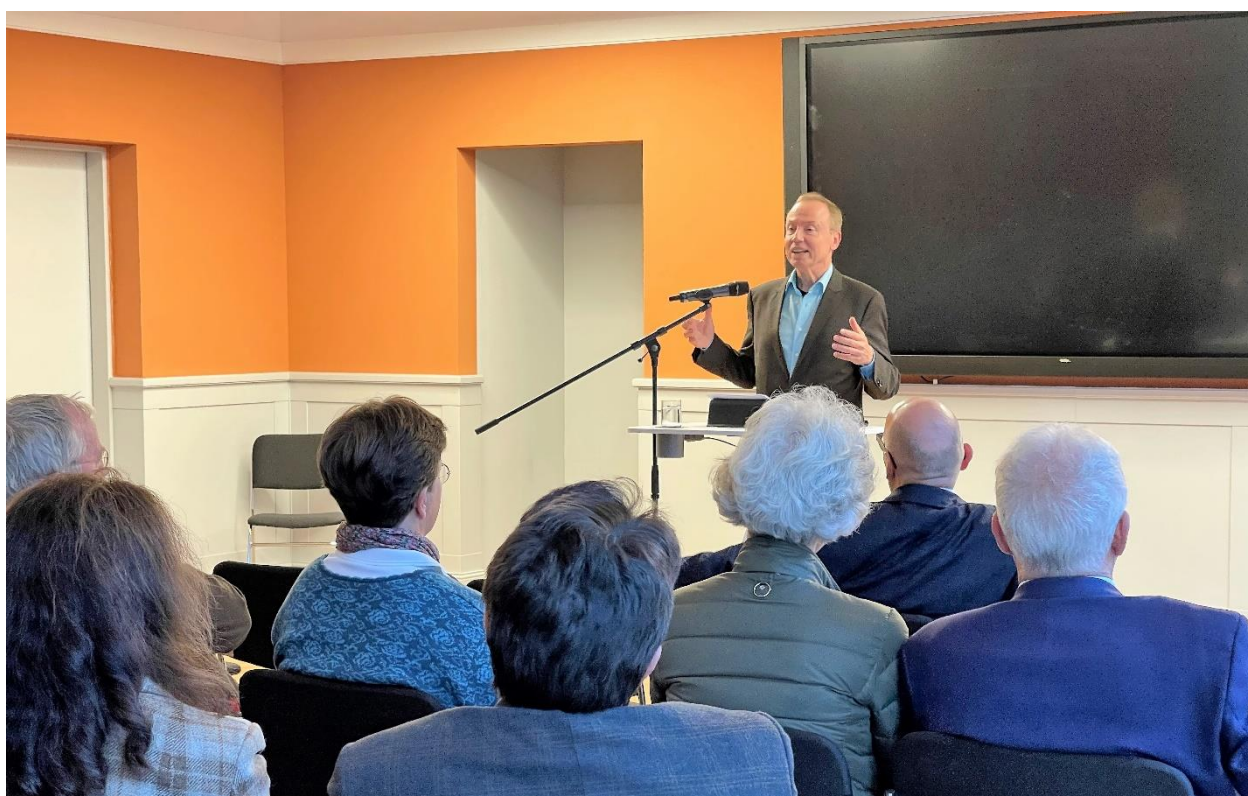
Der Vortrag vor geladenen Gästen stellte die Logotherapie Viktor Frankls als Schatzkammer aus vorbeugenden, belebenden und heilsamen Gedanken für den Alltag vor. Noch lange nach Ende der Veranstaltung diskutierten beeindruckte Teilnehmer über die im Vortrag gehobenen "Schätze", die Kraft haben, das Leben klarer zu sehen und besser zu meistern.