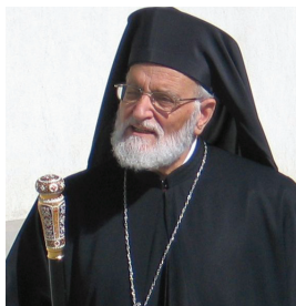
Patriarch Gregorios II. Laham

Moderation: André Stiefenhofer, Päpstliche Stiftung KIRCHE IN NOT