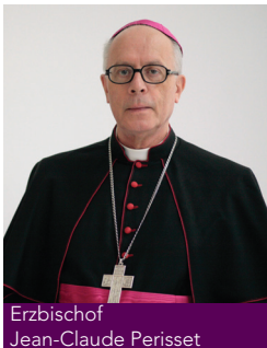
Erzbischof Jean-Claude Perisset